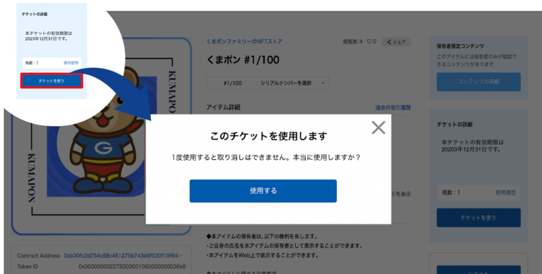
<チケット機能の利用イメージ画面>

「チケット機能」は利用回数指定や履歴確認が可能となっているため、購入者が取得したアイテムをライブやスポーツ観戦、展示会など様々なイベントの入場/観戦チケットとしても利用でき、イベント終了後には記念チケットとしてアイテムを保有することができます。