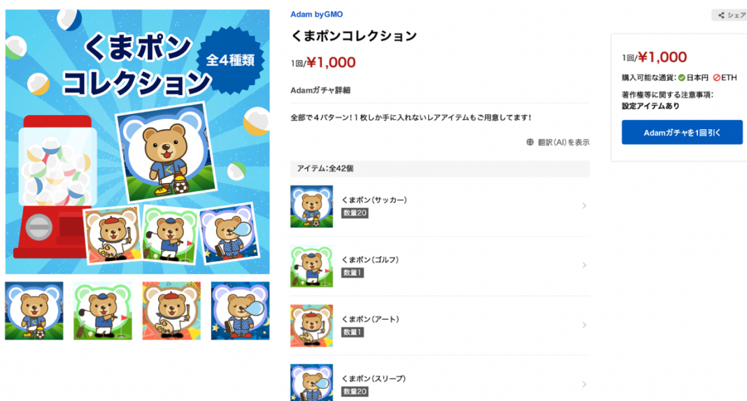
<Adam ガチャ機能の利用イメージ画面>

コンテンツホルダーが用意する複数のアイテムから構成されるコレクションの中から、どのアイテムが出るか分からないという楽しみをお届けします。