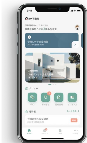
▲新しくなった入居者アプリのトップ画面

トップ画面は、パッと見たときに何がどこにあるのが瞬時に把握できるような配置へ一新しました。直感的なUIへアップデートを行ったため、これまで以上に使いやすく、重要な情報がわかりやすくなりました。アプリを使い慣れない方でも安心して快適に利用できます。