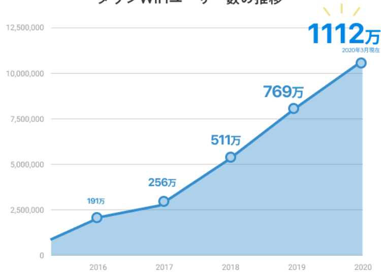
タウンWiFiユーザー数の推移