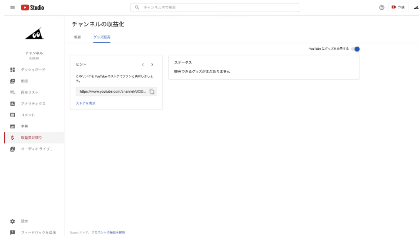
▲設定完了後のYouTube Studioの「収益受け取り」画面