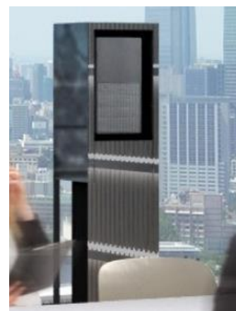
<ローカル 5G 基地局（渋谷フクラス）イメージ>