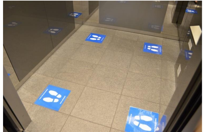
▲ (左) グループ第2本社「渋谷フクラス」総合受付 (右) オフィスエレベーター内