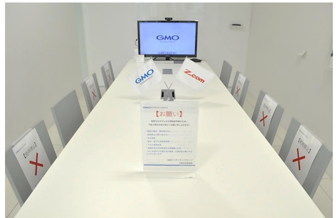
▲ (左) グループ第2本社「渋谷フクラス」会議室 (右) グループ本社「セルリアンタワー」会議室

GMO インターネットグループでは、グループパートナーの身を守るため、引き続き新型コロナウイルスの感染拡大の状況に合わせて柔軟に対応してまいります。