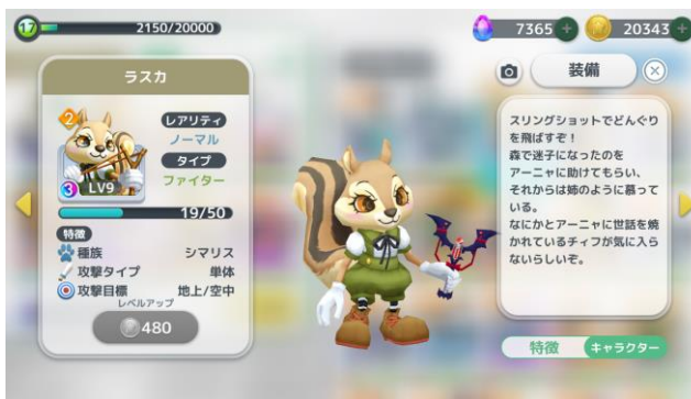
プリティバットショット