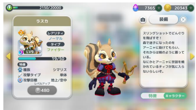
プリティヴァンパイア