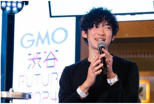
メンタリスト DaiGo 氏